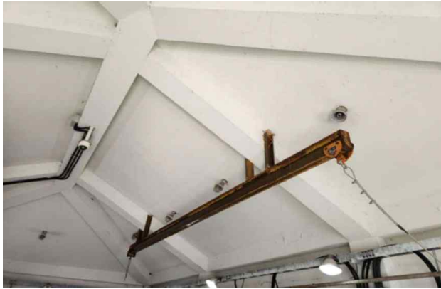
노후된 설비 인양 레일 구조물(회양처리장)