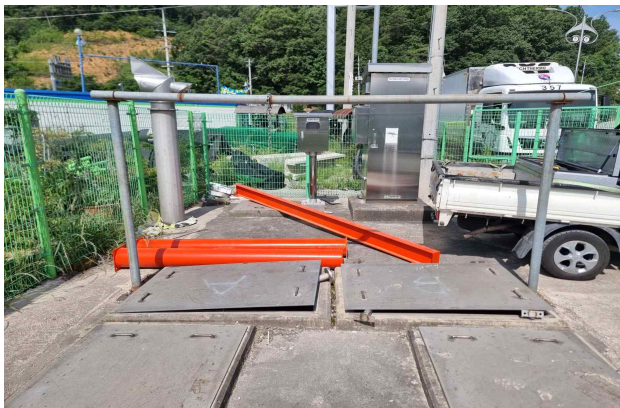
노후된 기존 인양대 철거(정양 증계펌프장)