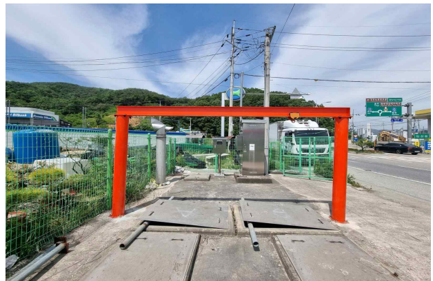
신규 인양대 교체 설치 완료