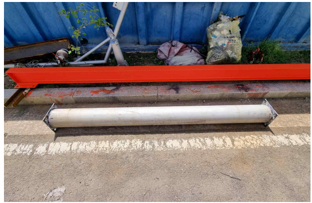
용접 후 녹방지 도색작업(2차 가공)