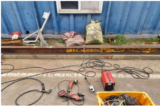
폐자재 녹 제거 및 페인트 제거(1차 가공)